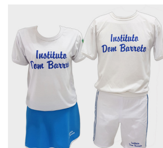
Uniforme para Educação Física