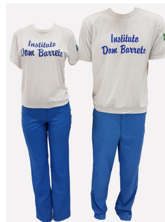
Uniforme para uso diário