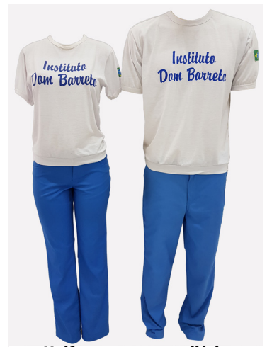
Uniforme para uso diário