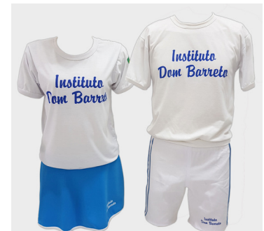
Uniforme para Educação Física